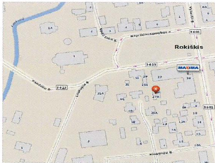
1 paveikslas. Planuojamos teritorijos padėtis vietovėje

1.3 PLANUOJAMA TERITORIJA: žemės sklypas, esantis Rokiškio rajono savivaldybėje, Rokiškio m., Nepriklausomybės a. 27A (žr. 1 pav.). Planuojamas plotas ~ 0,04 ha.