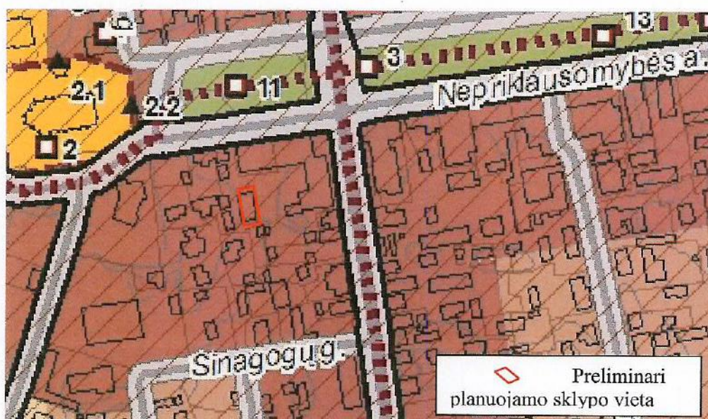
2 paveikslas. Ištrauka iš bendrojo plano ties planuojama teritorija

Urbanistinė situacija. Planuojama teritorija yra centrinėje Rokiškio miesto dalyje (žr. 1 pav.), šalia Nepriklausomybės aikštė ir pagal 2.21 punkte nurodytą planavimo dokumentą priskiriama kitos paskirties žemės prioritetui (žr. 2 pav.). Rytinėje planuojamos teritorijos pusėje - 0,8 km atstumu, Rokiškio I ir II tvenkiniai, vakarinėje pusėje - 0,3 km atstumu teka Laukupės upė. Ties Nepriklausomybės aikšte yra kultūrinio paveldo paminklai – bažnyčia, koplyčia, miesto istorinė dalis, paminklai. Sklypas patenka į Rokiškio miesto istorinės dalies, u.k. 17102, teritoriją, bei miesto istorinio centro teritoriją.